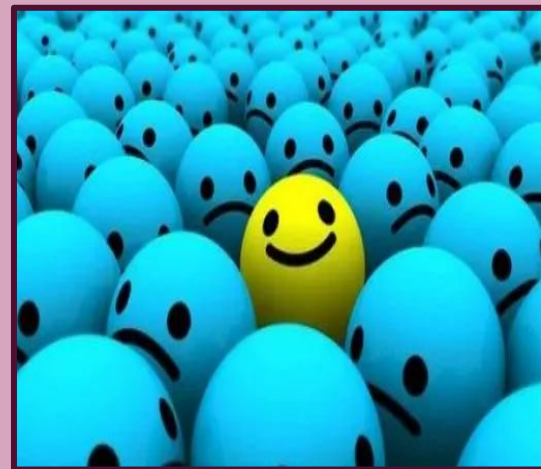
ATTEGGIAMENTO MENTALE POSITIVO