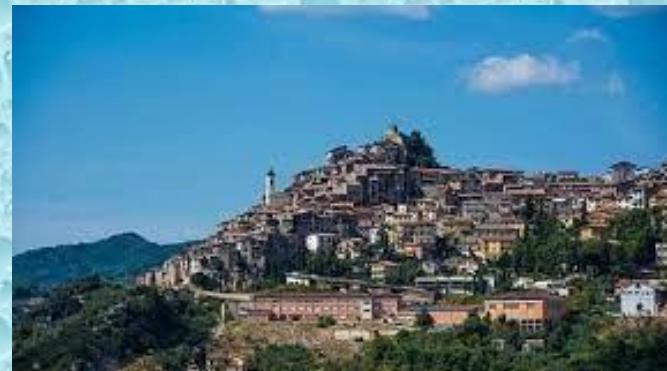
Comune di Olevano Romano