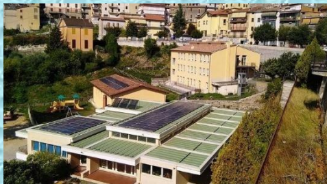
Plesso di Rocca S. Stefano