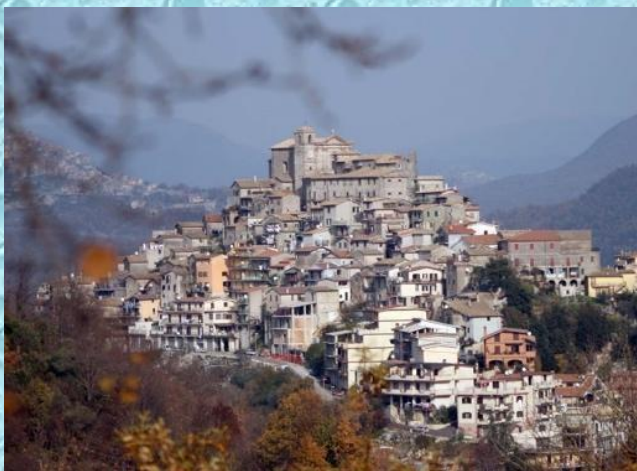
Comune di Rocca Santo Stefano