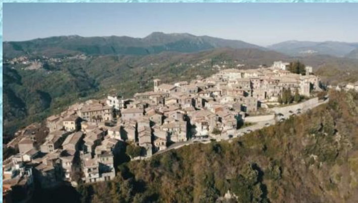
Comune di Bellegra