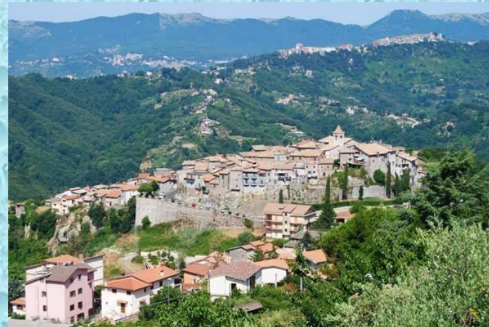
Comune di Roiate